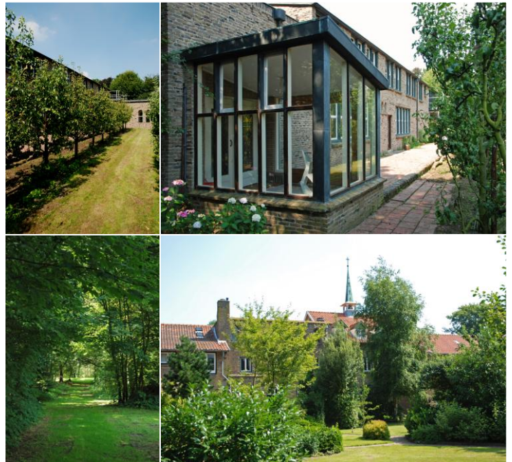
Impressie van de omgeving

Leidraad in onze meerdaagse programma's : spiritualiteit ontdekken, elkaar ont-moeten en komen tot handelen. Uiteindelijk gaat het om "dat" wat we bijdragen aan de wereld rondom ons.