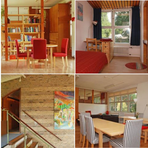
Ruimtes in het gebouw

Het Liobaklooster neemt een bijzondere plek in, in de programma's van de Lioba School voor Vrede. Deelnemers ontmoeten de kloosterlingen in de gesprekken of workshops. De School handelt vanuit de overtuiging dat iedere religie waardevol is en dat deelnemers door spiritualiteit te ontdekken, hun innerlijke kracht ontwikkelen. Het klooster is een voorbeeld van spiritueel leven en geeft daarmee inspiratie voor ieders persoonlijke zoektocht.