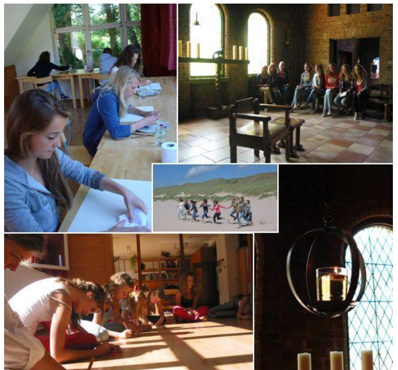
Leerling-groep van het Mendelcollege

Kijk voor de programma's op www.schoolvoorvrede.nl